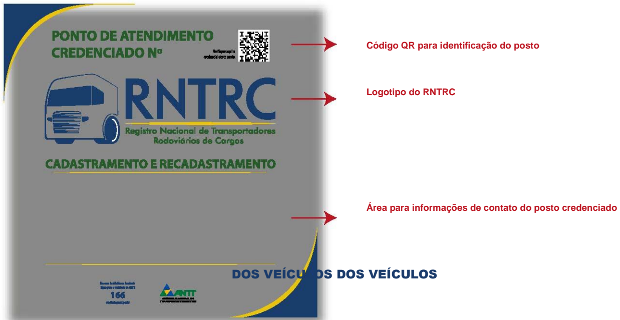
Figura 3 - Identificação de ponto de atendimento

A lista dos postos credenciados poderá ser acessada a partir do QR-Code (código de barras bidimensional) estampado no banner de identificação, conforme a figura a seguir.